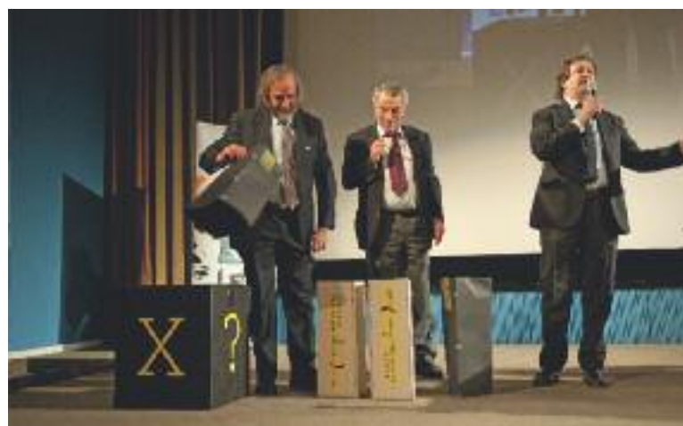
Un momento de "Tutti i colori del Giallo", edizione 2014

Prevendita biglietti: sabato 25 aprile (dalle 9.00 alle 11.00) e lunedì 27 aprile (dalle 19.00 alle 21.00) presso la Biblioteca comunale in Via San Gottardo.