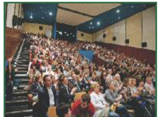
pag. 7 "Tutti i colori del giallo" torna il 6-7-8 maggio 2015