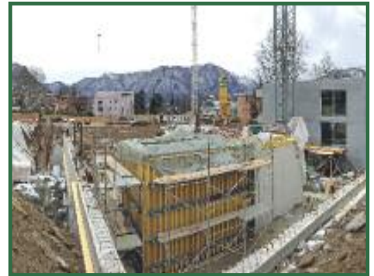
pag. 5 Situazione cantiere Nosedo

Emblematico, ma soprattutto preoccupante bilancio di una politica che forse necessita veramente