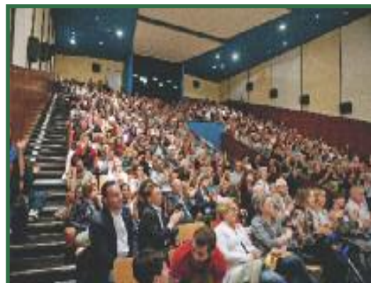
pag. 7 "Tutti i colori del giallo" torna il 6-7-8 maggio 2015