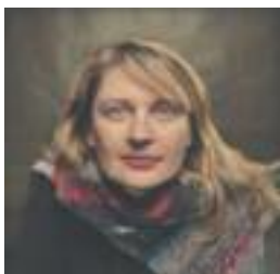
foto) specialista in attivazione.