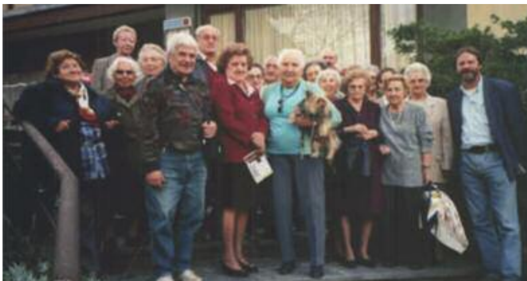
Visita al rifugio animali di Gorduno-Gnosca

Il Centro organizza regolarmente tombole, gite, pranzi/cene a tema, attività culturali; canto e cucina, nell'ottica di mantenere una vita sociale attiva e partecipata.