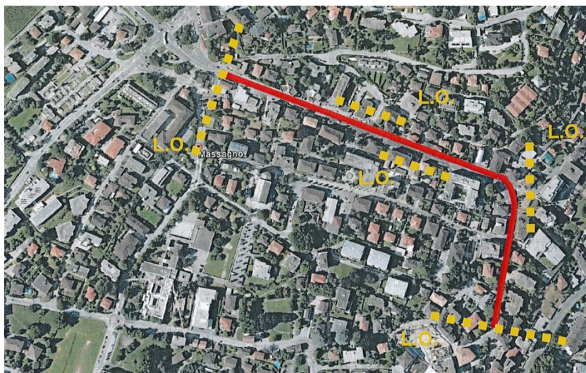
Estratto Google Earth con limiti d'opera

Il DT, rappresentato dall'Ufficio della progettazione Sottoceneri, ha incaricato uno Studio d'ingegneria (Consorzio Luvini Sagl e Martinenghi SA, Agno) di allestire il progetto definitivo (comprensivo di pubblicazione, appalto e esecuzione) della riqualifica urbana di via San Gottardo a Massagno.