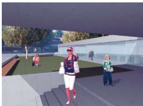
Vista prospettica piazzale livello posteggi (entrata principale scuola)

Considerata l'importanza dell'argomento, riteniamo cosa utile riportare alcuni estratti del Messaggio Municipale in questione, al fine di una migliore informazione della popolazione, la decisione del Consiglio comunale è prevista nella seduta convocata per il 29 settembre 2008.