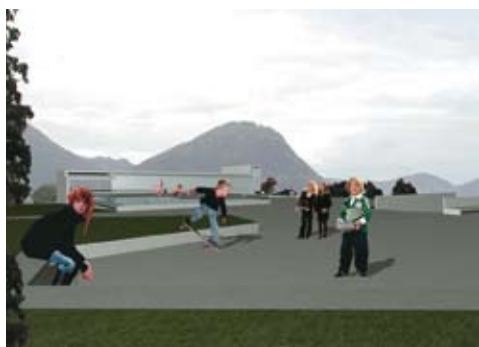
Vista prospettica spazio esterno da Via Foletti