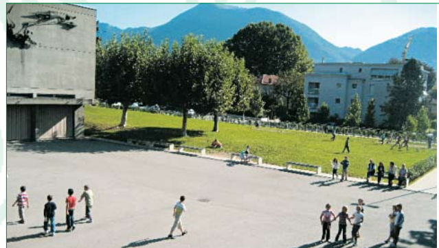
9 Richiesta credito ristrutturazione Scuole Nosedo