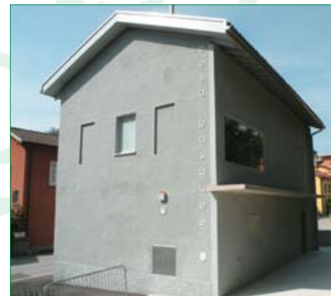
A disposizione la Casa Pasquee