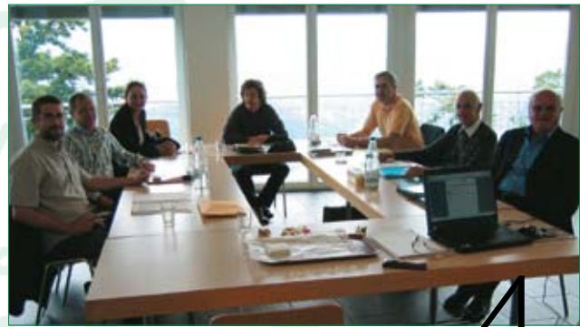
Programma di legislatura

Un programma che riprende e riconferma la volontà di determinare al nostro Comune quelle condizioni di svilup-