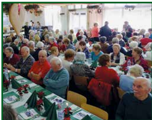
pag. 3 Festa degli anziani