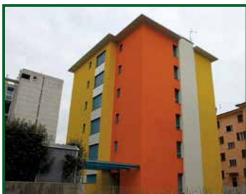
pag. 9 Casa IRIS