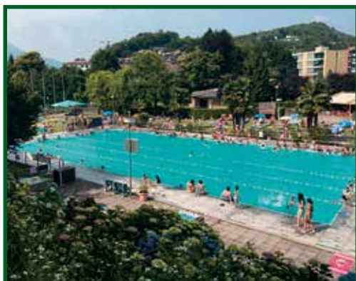
pag. 11 Ottima stagione al Valgersa